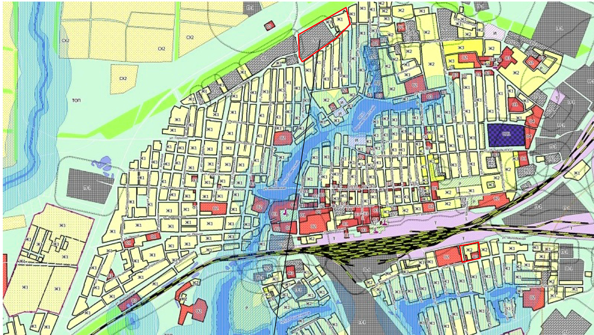
Проектируемая территория межевания